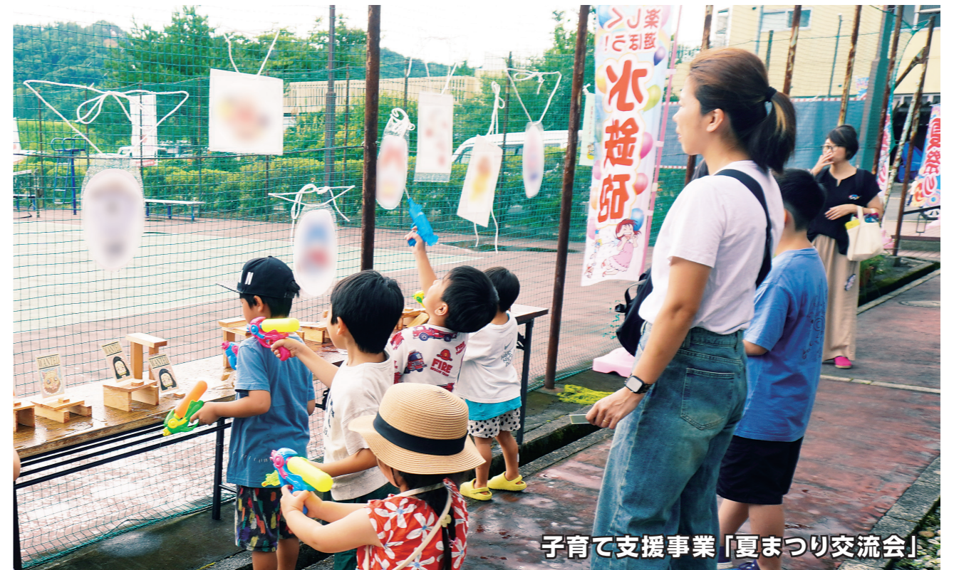
子育て支援事業「夏まつり交流会」