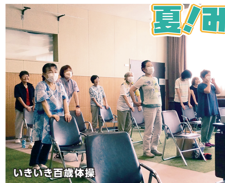
いきいき百歳体操

この夏も、中央コミセンはたくさんの笑顔であふれました。子どもから年配の方まで、それぞれが主役になって、暑い夏の活動を楽しく盛り上げてくださいました。元気いっぱい「夏の笑(ショー)タイム」を紹介します。