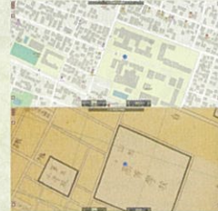
現在地図と古地図比較