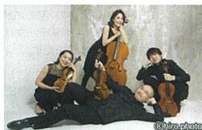
The 4 Players Tokyo