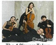
The 4 Players Tokyo

指揮者・藤岡幸夫のプロデュースのもと、音楽番組『エンターザ・ミュージック (BSテレ東 毎週土曜 朝8時30分放送)』から生まれたカルテット(弦楽四重奏団)が、文翔館にやってくる!