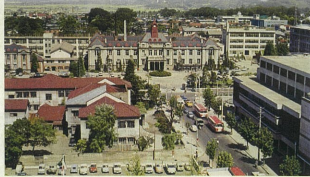
1960年代 山形県庁(現・文翔館)付近