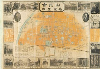
1910年代 山形市街地図

「山形アーカイブ」は、山形大学附属博物館をはじめとする山形県内の史料保存機関や、山形大学の学生で組織する「まちの記憶を残し隊」が集めたまちの「記憶」を一堂に公開するデジタル・アーカイブです。写真や絵葉書、古地図などの資料をインターネット上で閲覧することができ、山形市中心市街地の江戸時代から現代までの変化をたどることができます。また、「地図アプリ」ではスマートフォンなどを利用することで、出先で過去の地図と現在の地図を比較することができ、過去の街並みに想いを馳せながら街歩きを楽しめます。